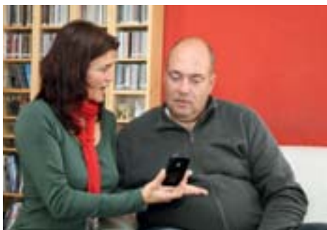
Oft helfen Beobachtungen der Partnerin oder des Partners bei der Diagnose.

Die Betroffenen selbst merken oft nichts von ihrem Schnarchen und den nächtlichen Atemstillständen – die Partnerin oder der Partner dafür umso mehr. Deren Beobachtungen helfen Ärztin oder Arzt. Deuten diese Symptome sowie weitere Risikofaktoren wie Übergewicht auf Schlafapnoe hin, werden meist Schlafuntersuchungen und Konzentrationstests durchgeführt.