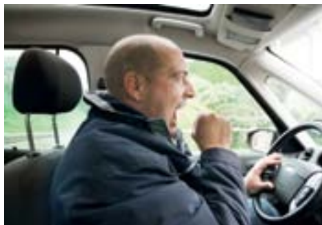
Sekundenschlaf: besonders gefährlich am Steuer.

Schlafapnoe-Betroffene erleben mehrere hundert Stress-Situationen pro Nacht: Die Atemstillstände und die darauf folgenden Aufwachreaktionen werden zwar nicht bewusst wahrgenommen, verhindern aber einen erholsamen Schlaf. Da vor allem die Tiefschlafphasen unterbrochen werden, fühlen sie sich am Morgen nicht ausgeruht und können sich tagsüber oft kaum wach halten. Auch die Konzentration bereitet Mühe. Immer wieder kommt es zu Sekundenschlaf: vor dem Fernseher, gelegentlich sogar am Arbeitsplatz oder – ganz gefährlich – im Strassenverkehr.