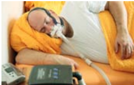
Die CPAP-Therapie: die bisher wirksamste Behandlungsmethode.

Das geschulte Personal der Lungenliga unterstützt die Patientinnen und Patienten beim Therapie-Start und unternimmt individuelle Einstellungen. Besonders wichtig ist die genaue Anpassung der Atemmaske, welche die ganze Nacht lang getragen werden muss.